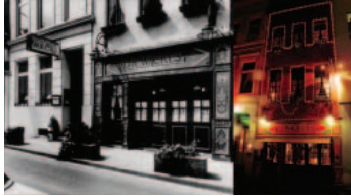
Damals und heute - auch äußerlich hat sich der WACKES verändert (Foto links: 1988; Foto rechts 2002)

Allerdings war der WACKES noch lange nicht so groß wie heute. Tatsächlich gehörte nur das Erdgeschoss zur Weinstube, der erste Stock wurde erst nachträglich zu einem Gesellschaftsraum umgebaut und später aufgrund der rasch wachsenden Beliebtheit und dem daraus resultierenden Platzmangel nahtlos in das Restaurant integriert. Die Fangemeinde wuchs munter und auch erste Auszeichnungen ließen nicht lange auf sich warten. Zwei weitere Geschosse